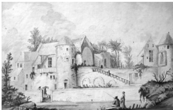
Les ruines du Château Royal de Senlis

Le site est classé au titre des Monuments Historiques.