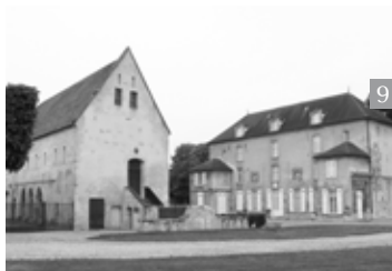
Aile occidentale logis du prieur du XVIII e siècle.