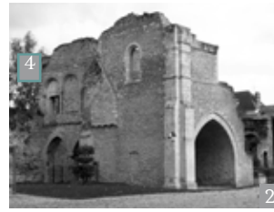
Talon du donjon médiéval.

Au rez-de-chaussée, les espaces sont séparés par deux arcades retombant sur un pilier. L'arcade brisée d'origine, plus large, est encore visible.